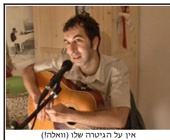
אין על הגיטרה שלו (וואלה!)

זו לא הפעם הראשונה ש"הפה" הופכים כל פרה קדושה לסטייק וול דאן, אלא שב"קליגרו" נוסף ממד שלא היה קיים ביצירה שלהם עד היום: רגש (הערת העורך: ואיך אתה קורה ל"שיר סיום", "התחבטות" ו"סטארט-אפ" אם לא שירים מרגשים?). אמנם אין כאן שבירת דיסטנס, אבל אפשר לזהות את השניות המעטות בהן השריון הניהיליסטי נסדק,